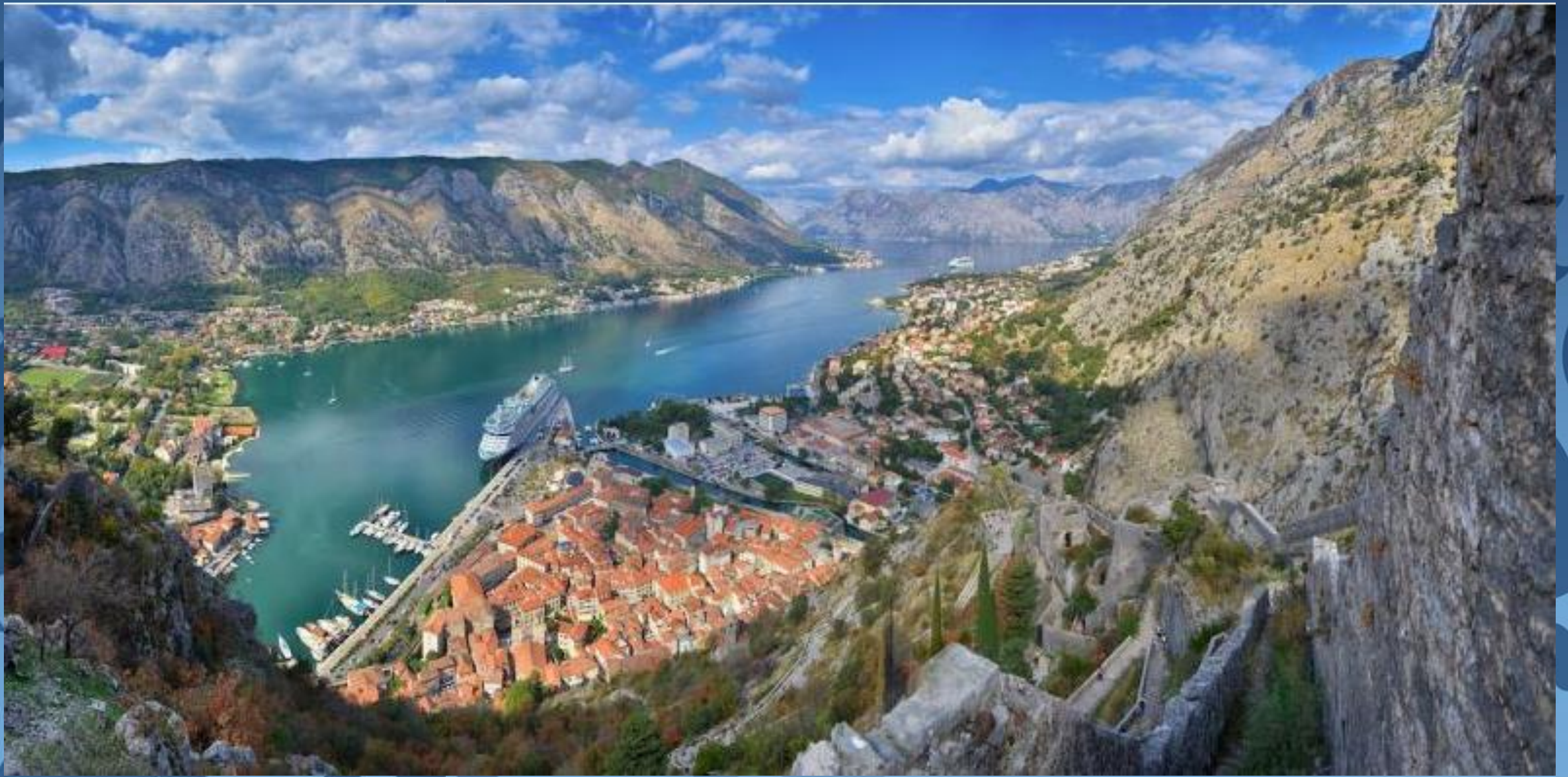
Blick auf Kotor - Montenegro